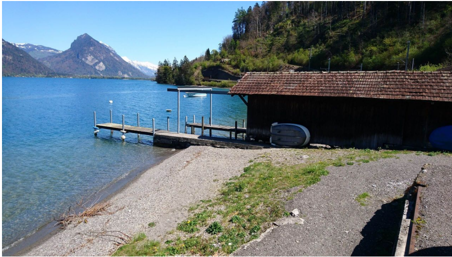
Bootswerft Wilke AG, Interlaken Tourismus - web@interlaketourism.ch