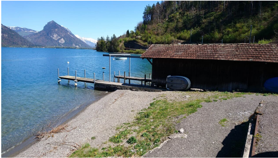
Bootswerft Wilke AG, Interlaken Tourismus - web@interlaketourism.ch