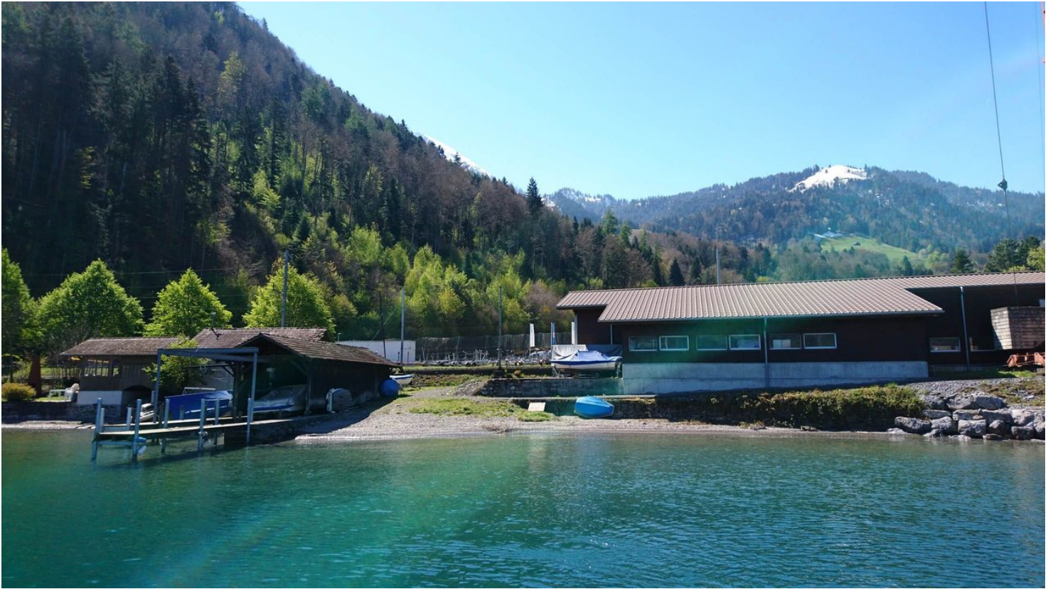
Bootswerft Wilke AG, Interlaken Tourismus - web@interlaketourism.ch