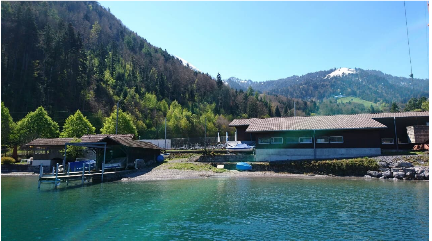
Bootswerft Wilke AG, Interlaken Tourismus - web@interlaketourism.ch