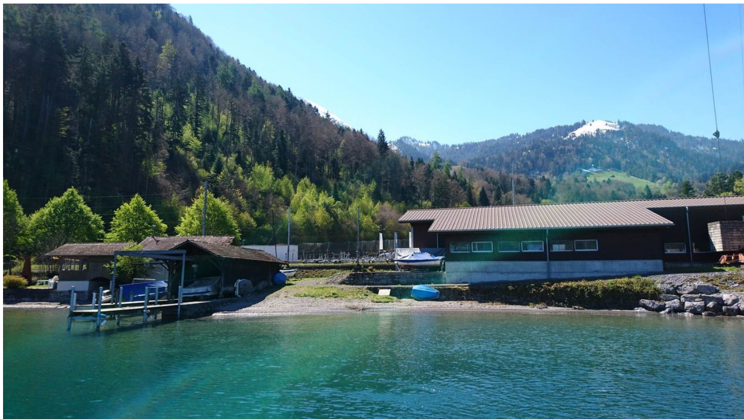
leissigen-bootswerft-wilke-thunersee