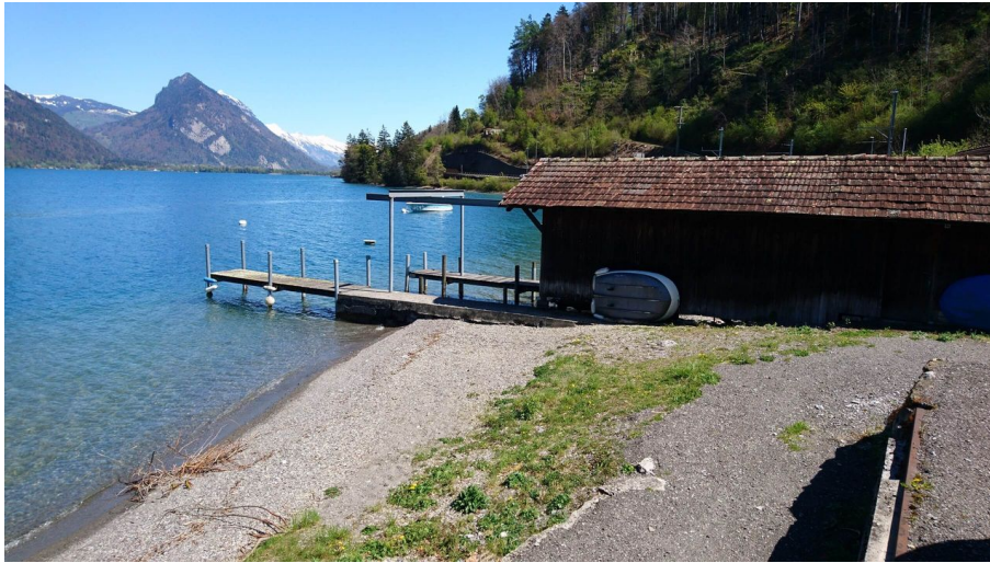
leissigen-bootswerft-wilke-sommer-thunersee