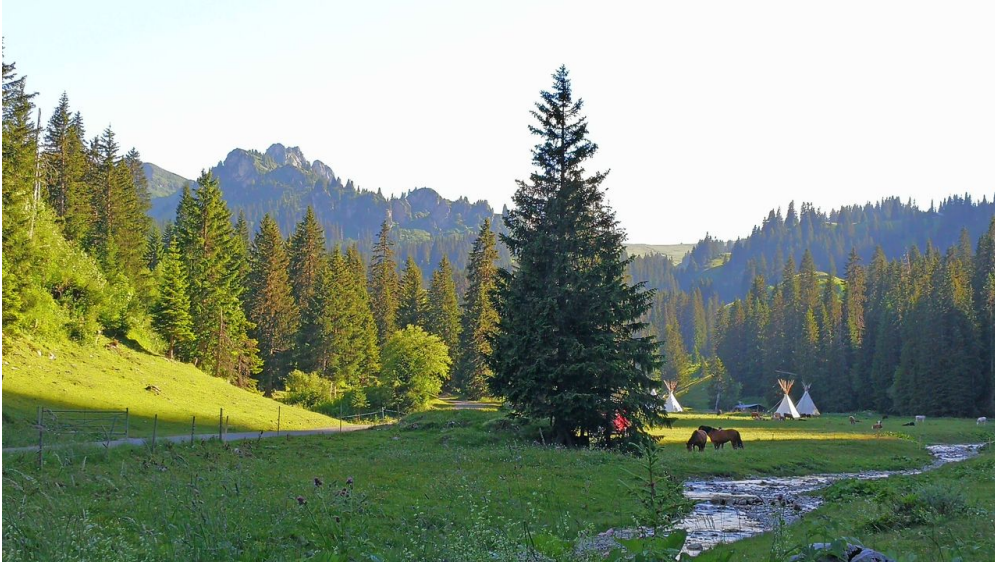
Foyer directement au bord du ruisseau de montagne - © Naturpark Diemtigtal