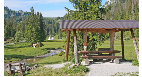
Foyer de Menigboden dans une région alpine romantique et sauvage