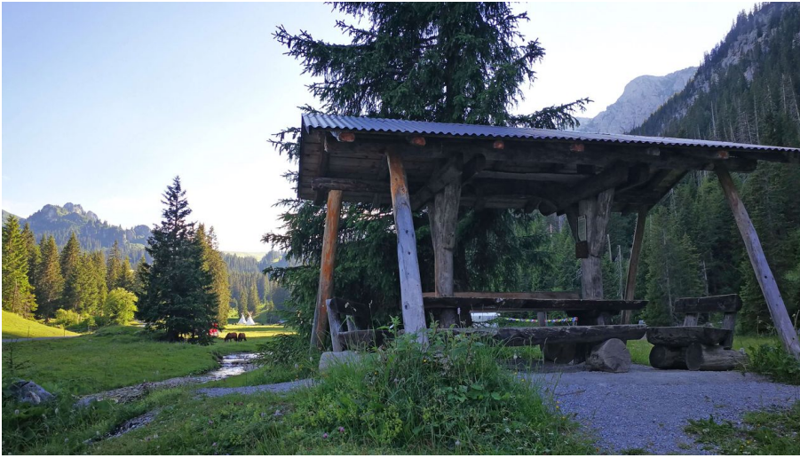
Possibilité de s'asseoir à l'abri près du foyer