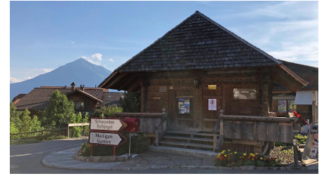
Sigriswil Tourismus, Interlaken Tourismus - web@interlakentourism.ch