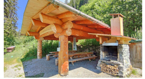
feuerstelle-schwingerweg-springenboden-gedeckter-platz-1.jpg - - web@interlaketourism.ch