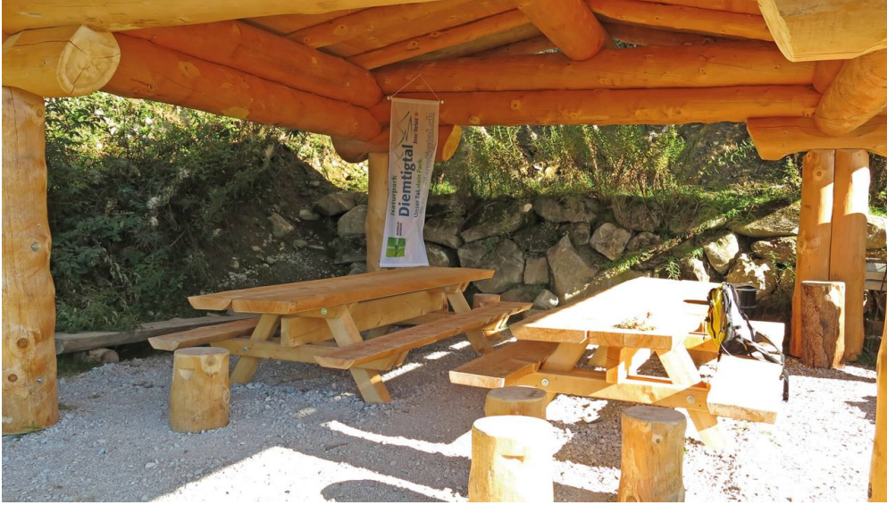
naturpark-diemtital-feuerstelle-schwingerweg-sitzplatz