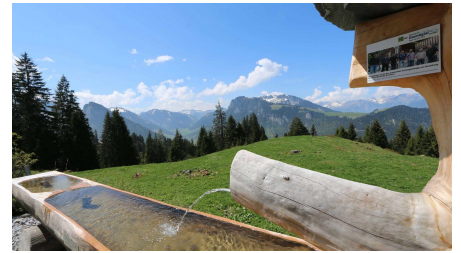
feuerstelle-schwingerweg-springenboden-brunnen.jpg