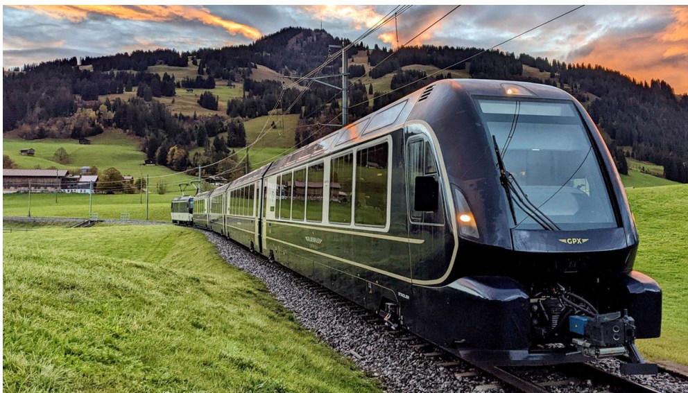
golden-pass-express-unterwegs-sommer-wiese-huegel-wolken.jpg