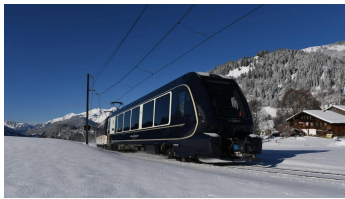
golden-pass-express-winter-schnee-unterwegs.jpg