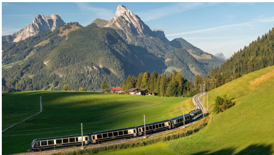
golden-pass-express-sommer-berege.jpg