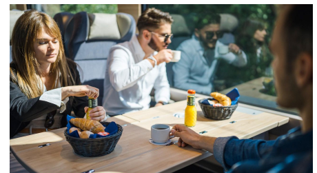
golden-pass-express-kafee-fruestuck-gaeste.jpg