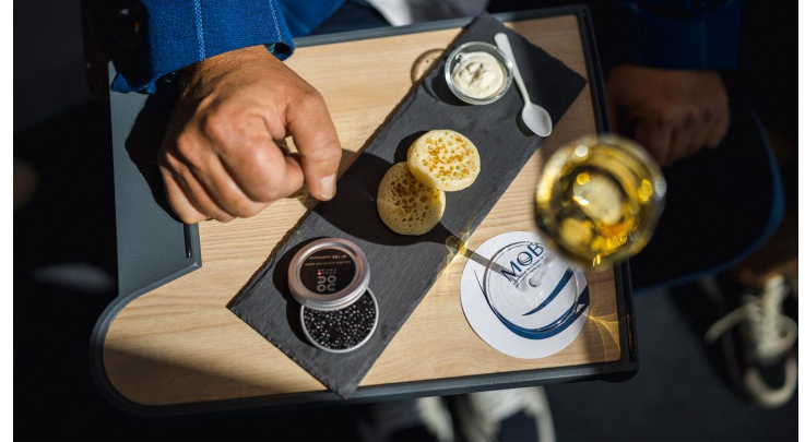
golden-pass-express-catering.jpg