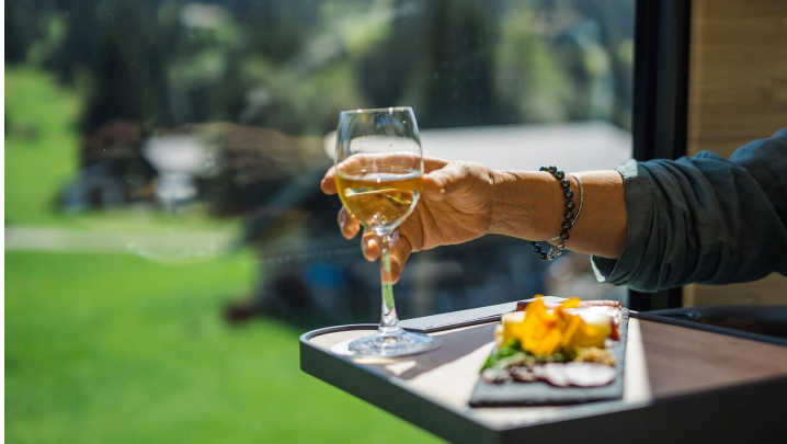
golden-pass-express-hand-mit-weinglas.jpg