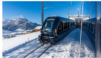
golden-pass-express-winter-schnee-zug-kreuzung.jpg