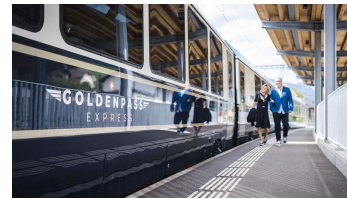
golden-pass-express-bahnhof-gaeste.jpg