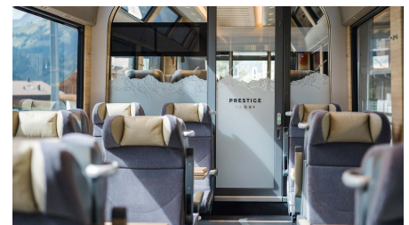
golden-pass-express-sitze-prestige.jpg