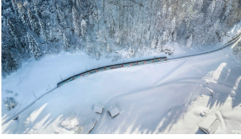
luzern-interlaken-express-winter-zugfahrt