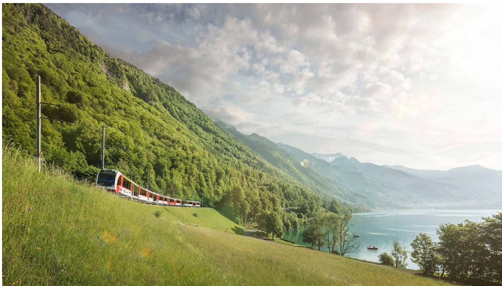
zentralbahn-zug-fruehling-wiese-blumen-brienzersee-brienz-oberried.jpg