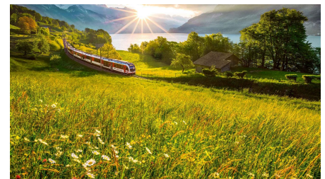
zentralbahn-brienzersee-fruehling-morgen-sonnenaufgang.jpg