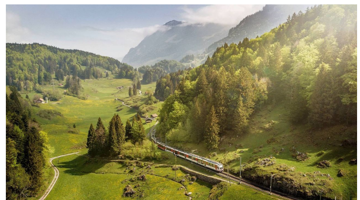
luzern-interlaken-express-sommer-zentralbahn-haslital