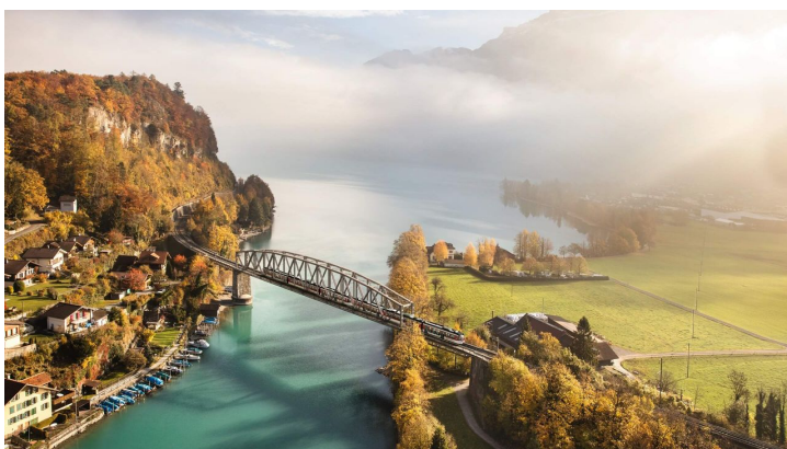
zentralbahn-luzern-interlaken-express-br-cke-aare-brienzersee-herbst