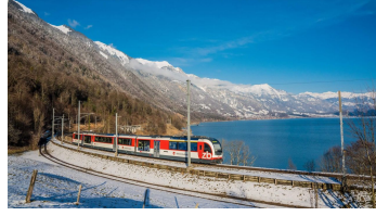
zentralbahn-luzern-interlaken-express- brienzersee-winter