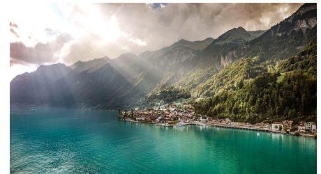
luzern-interlaken-express-herbst-zentralbahn-brienz