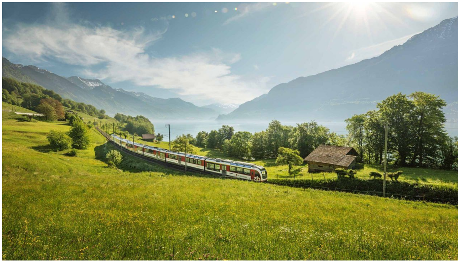
zentralbahn-zug-fruehling-wiese-blumen-brienzersee-oberried.jpg