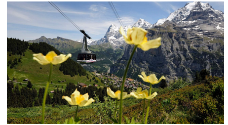
schilthorn-seilbahn-blumen