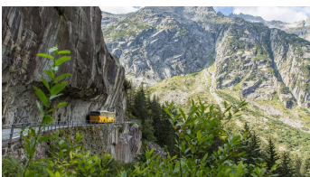
postauto-paessefahrten-zentralalpen-herbst-copyright-postauto