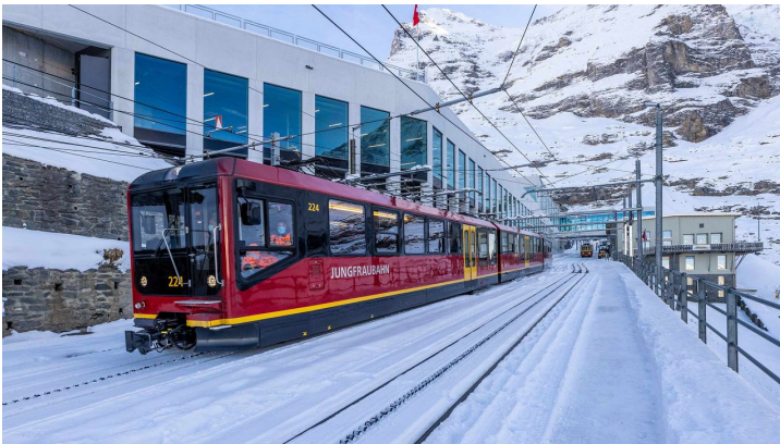
jungfraubahn-station-eigergletscher-winter.jpg