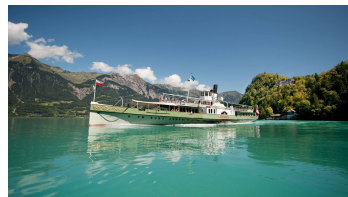
brienzersee-schiffahrt-sommer-loetschberg-dampfschiff-giessbach