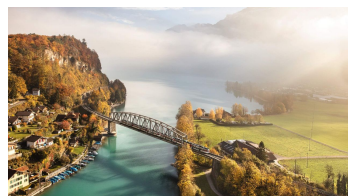
zentralbahn-luzern-interlaken-express-br-cke-aare-brienzersee-herbst