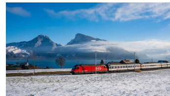
bls-bahnfahrt-winter-panorama-thunersee-zug