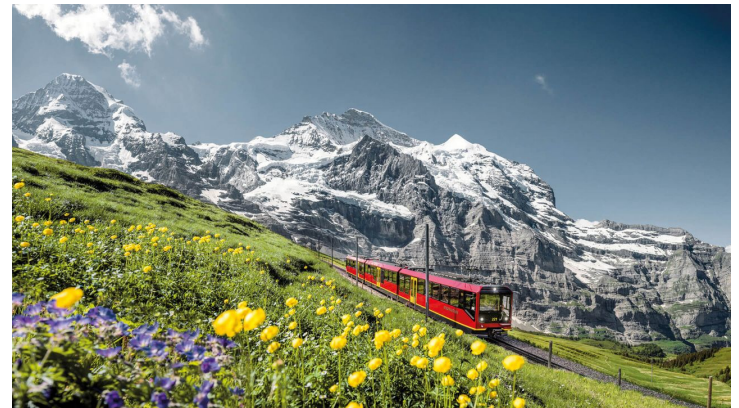
jungfrauoch-jungfraubahn-moench-jungfrau-sommer