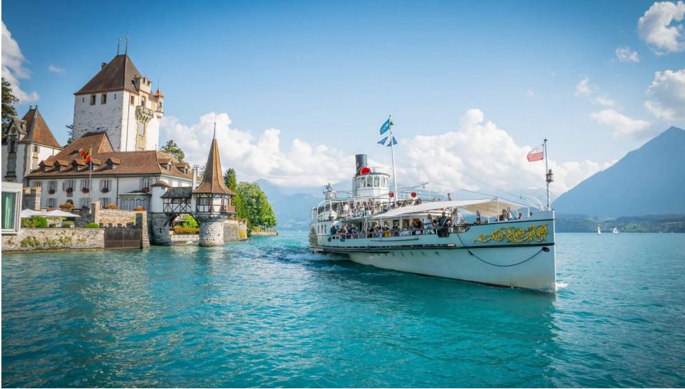
oberhofen-schloss-schiff-bluemlisalp-sommer-dampfschiff-niesen