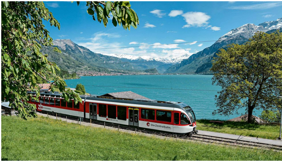
zentralbahn-brienzersee-ebliigen-zug.jpg