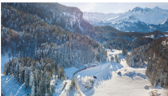
luzern-interlaken-express-winter-zentralbahn