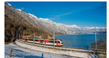
zentralbahn-luzern-interlaken-express-brienzersee-winter