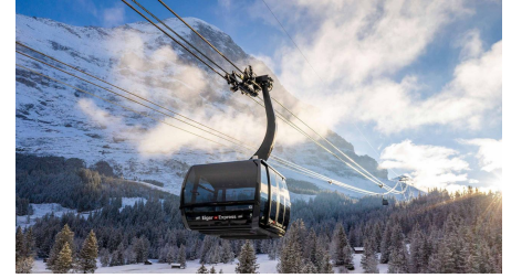
eiger-express-gondel-schnee-winter-wolkenfetzen.jpg