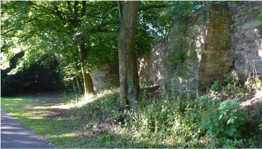
stadmauer-stephanberg - © Stephan Berg, Stephan Berg