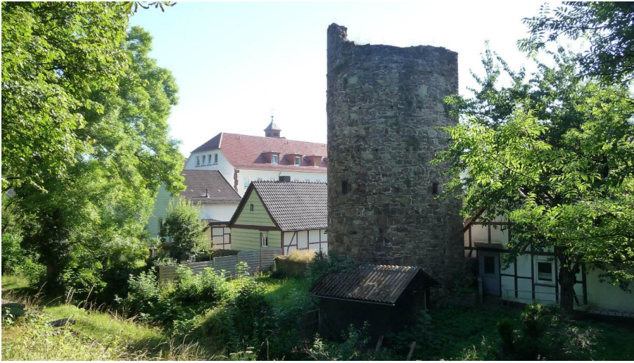
stadtturm-stadtwall-stephanberg - © Stadt Höxter, Stephan Berg