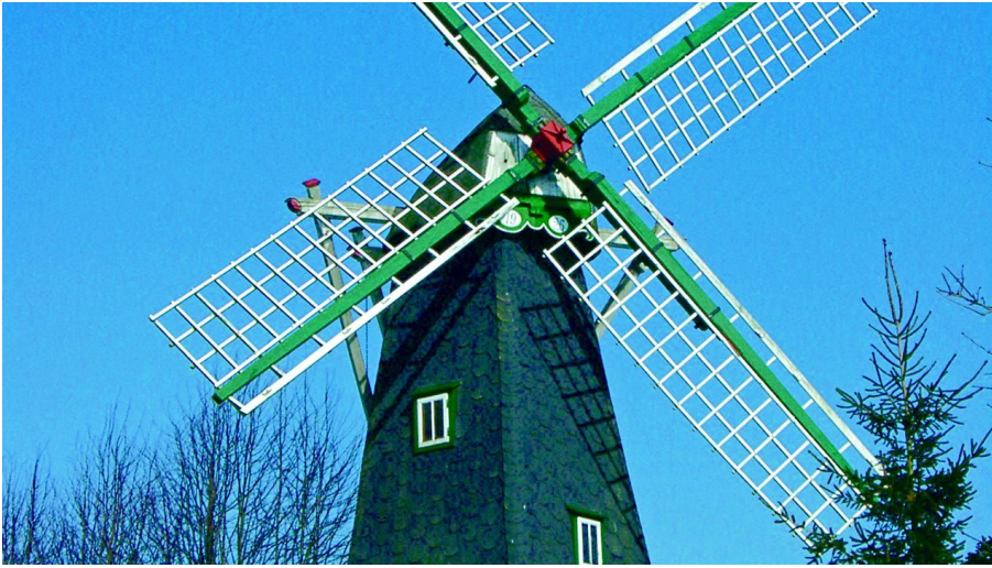
Dellstedter Bauernwindmühle