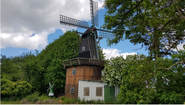
Dellstedter Bauernwindmühle