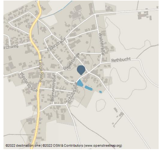
©2022 destination.one | ©2022 OSM & Contributors (www.openstreetmap.org)