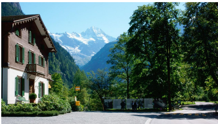
stechelberg-truemmelbachfaelle-eingang