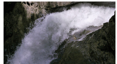
stechelberg-truemmelbachfaelle-wasser