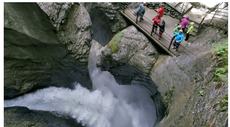
stechelberg-truemmelbachfaelle-plattform-wasser-felsen