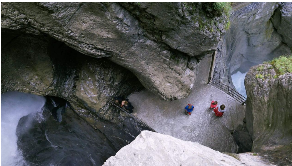
stechelberg-truemmelbachfaelle-plattform