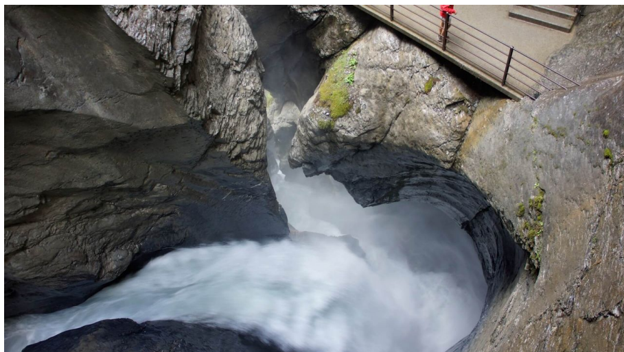
stechelberg-truemmelbachfaelle-wasser-steine-plattform