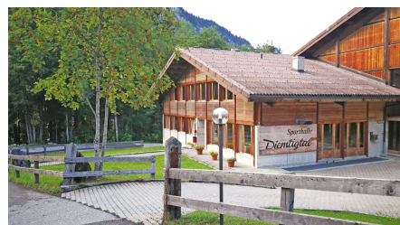
Eingang der Sporthalle Wiriehorn