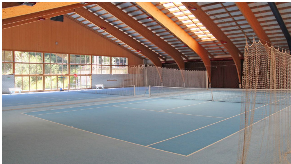
Helle und freundliche Tennishalle in der Sporthalle Wiriehorn