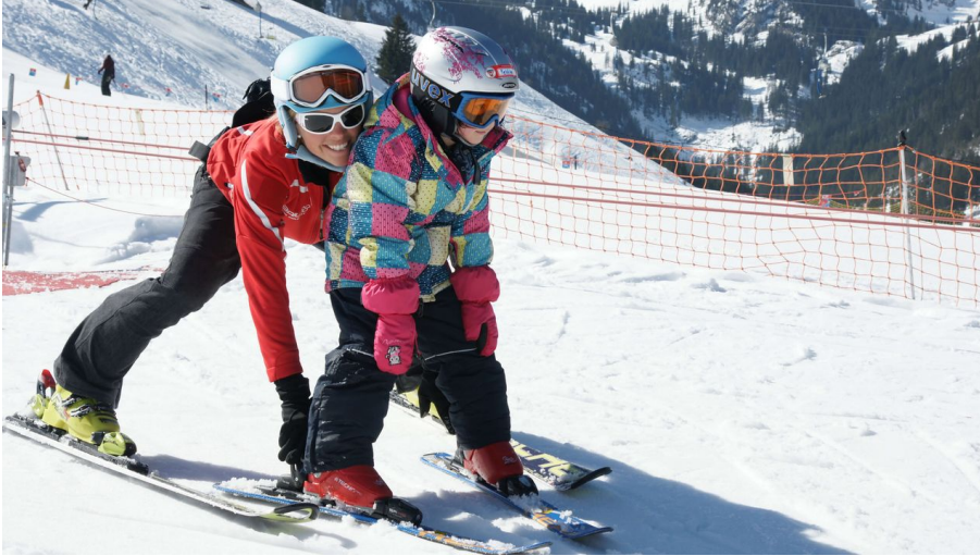
La monitrice de ski montre à son élève comment freiner