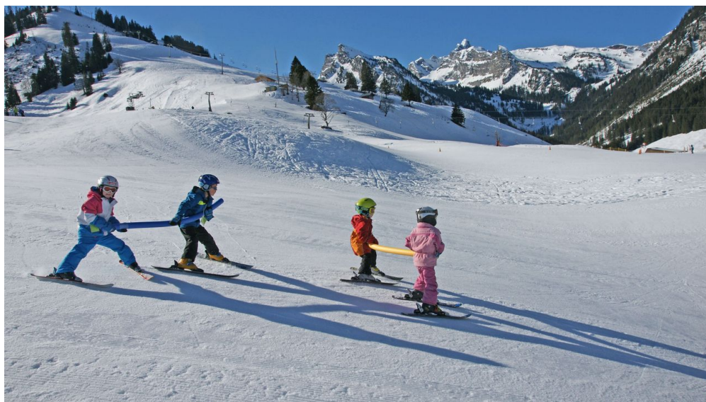
S'amuser avec d'autres enfants à l'école de ski Grimmelalp

Tu trouveras les dates des cours sur skischule-diemtigal.ch Cours privés sur demande