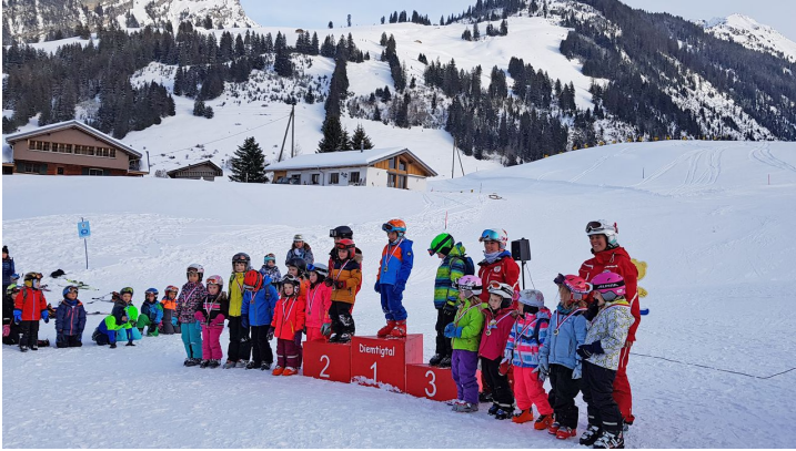
Des enfants fiers à l'annonce du classement de la course de l'école de ski