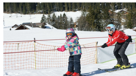
Schon bald fahren die Skischüler fast alleine mit dem Seillift - © Schweizer Skischule Grimmelalp