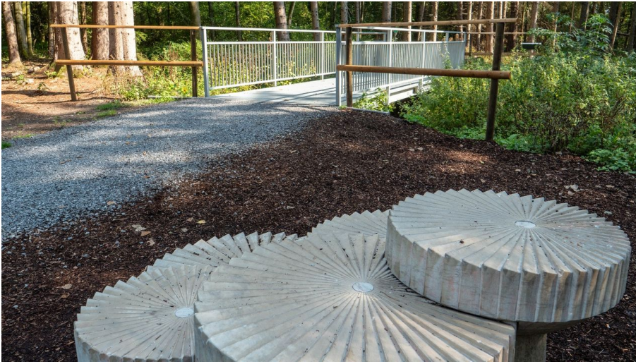
Mühlsteine an der neuen Emsbrücke