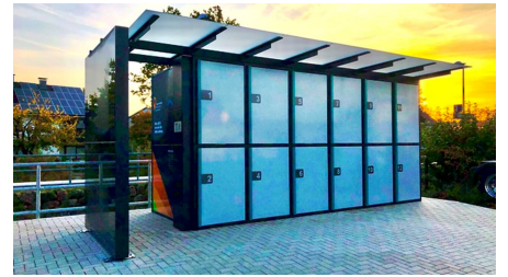
Bikebox am Bahnhof in Schloß Holte-Stukenbrock