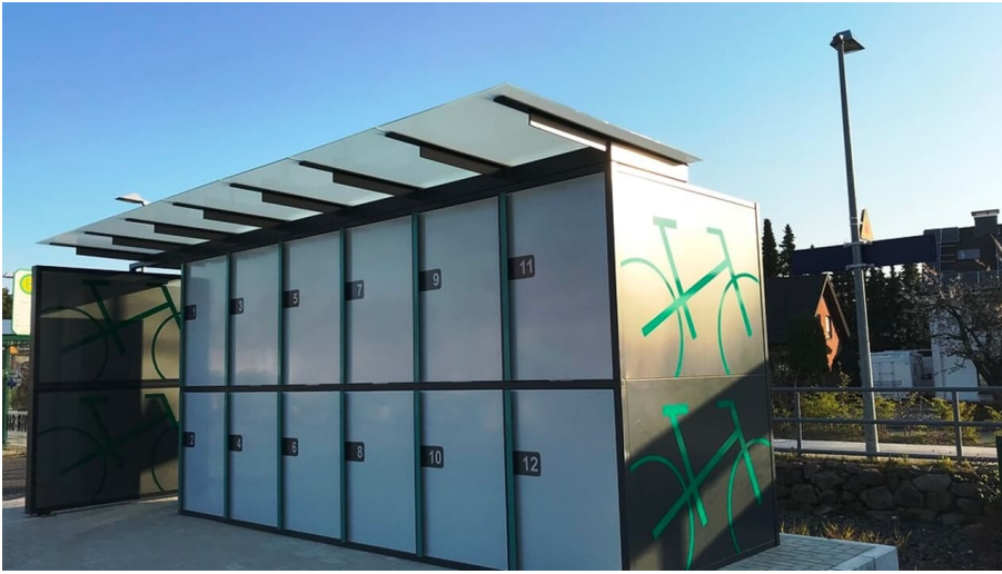
Bike-and-Park-Box am Bahnhof Schloß Holte