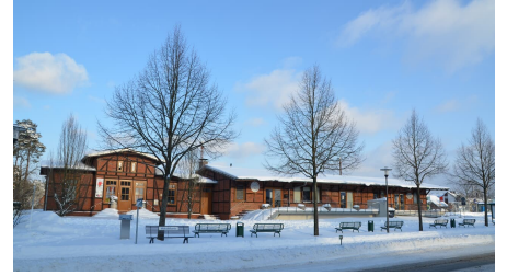
Winterlicher Bahnhof von Schloß Holte-Stukenbrock