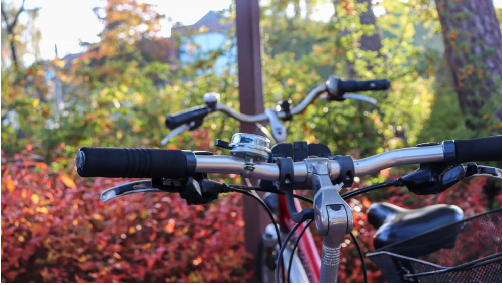
Fahrrad in Schloß Holte-Stukenbrock