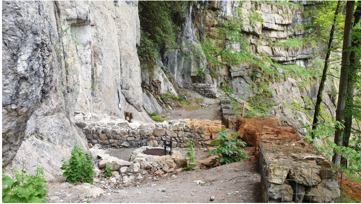
wilderswil-ruine-rothenfluh-braetelstelle-fruehling-wanderweg