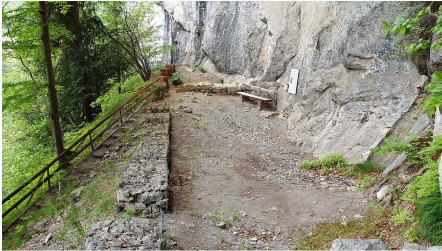
wilderswil-ruine-rothenfluh-wanderweg-fruehling