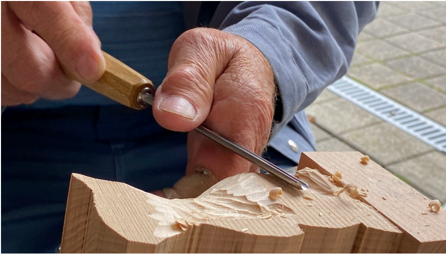
Kunstschaffende bei der Arbeit