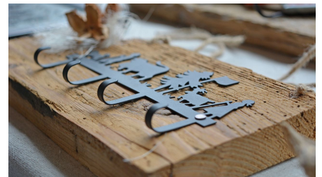
Garderobe mit Scherenschnitt