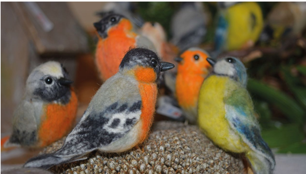
Lustige kleine Filzvögel täuschend echt

Kinderspielplatz (im Freien), WC-Anlage, Barrierefreies WC, Barrierefreier Zugang