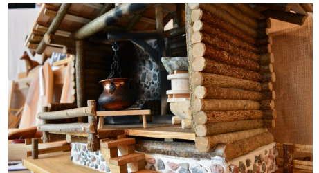
Sennhütte aus Holz