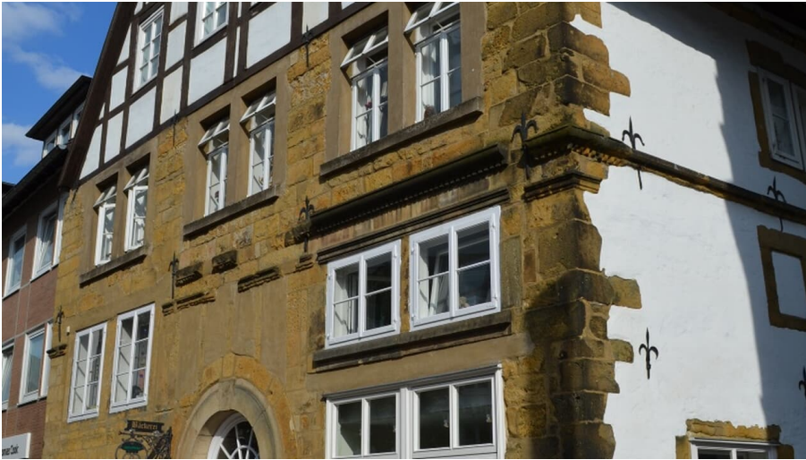
Haus Müller