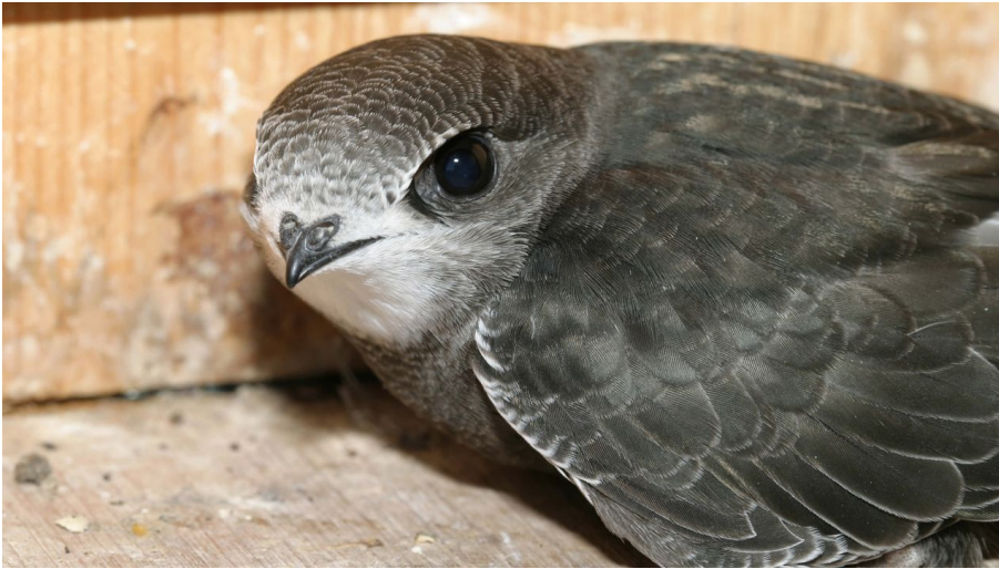
Junger Mauersegler vor dem Abflug