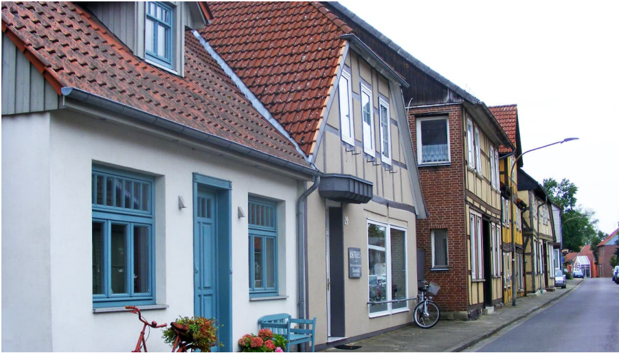
Achterstraße in Wittingen