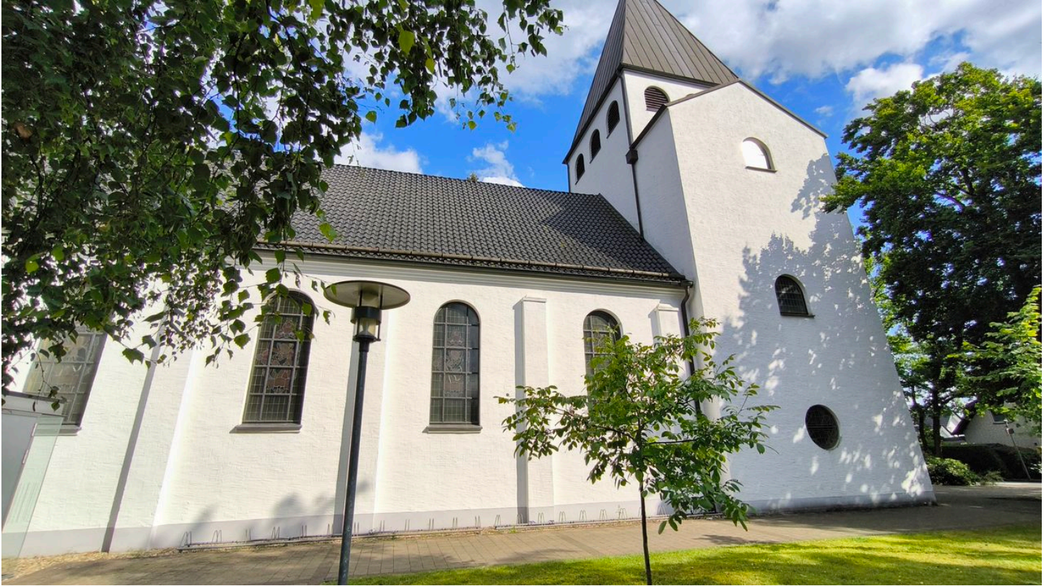
Herz-Jesu-Kirche Hövelriege