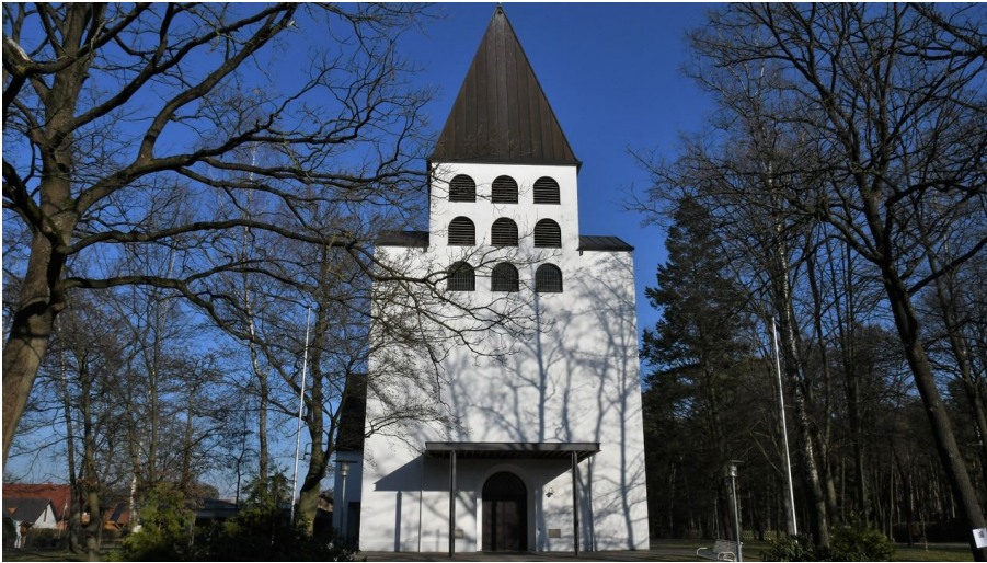
Herz-Jesu-Kirche in Riege - © Raphael Athens, Katholische Kirche