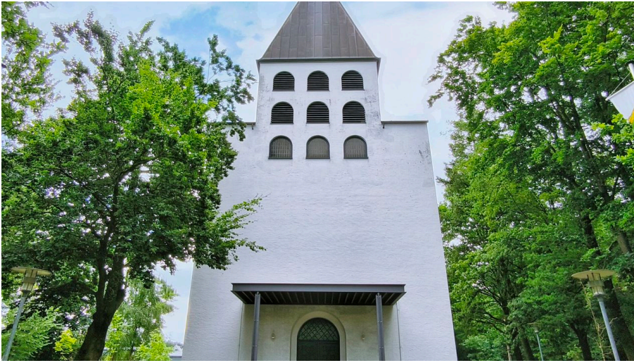
Herz-Jesu Kirche Hövelriege