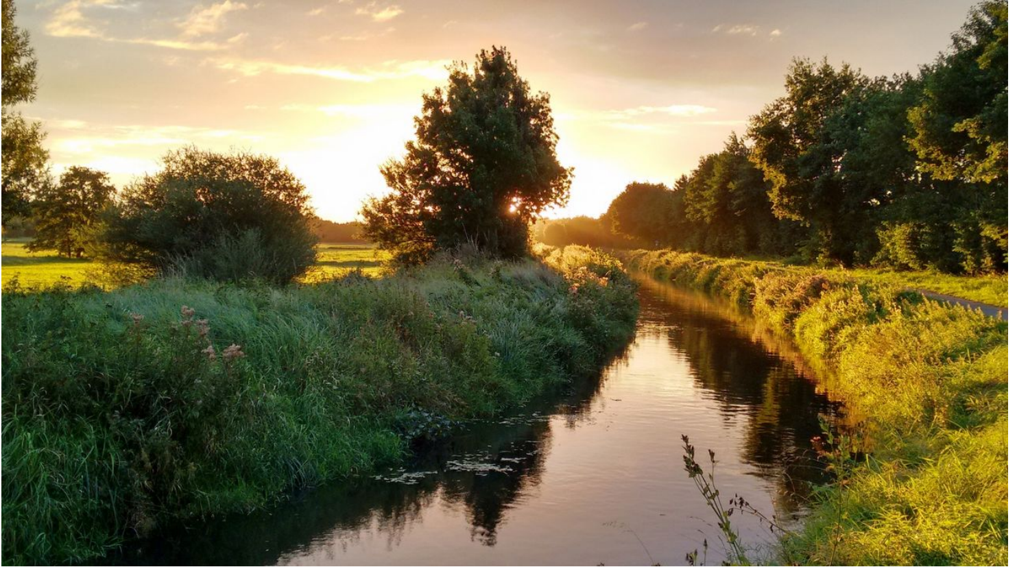
Rietberger Emsniederungen