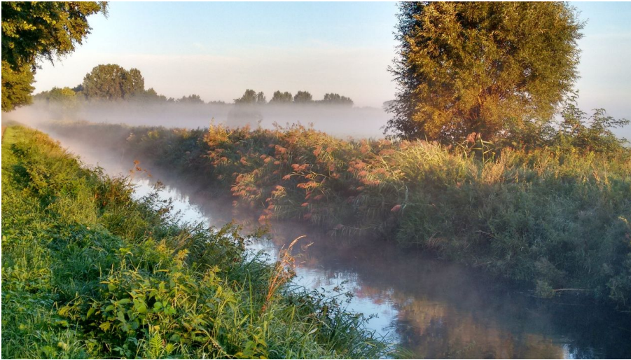
Rietberger Emsniederungen