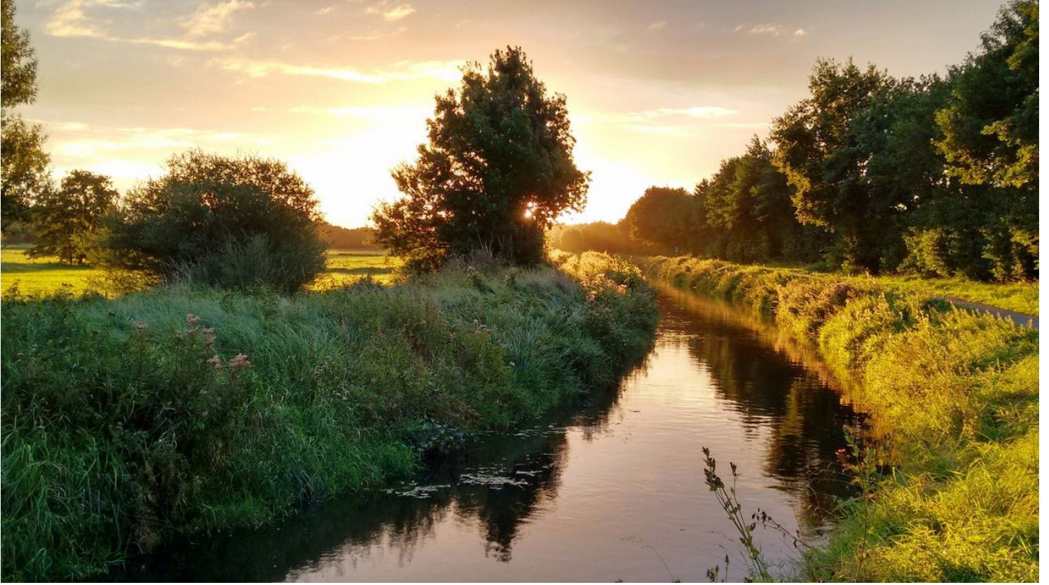
Rietberger Emsniederungen - © Werner Hartkamp