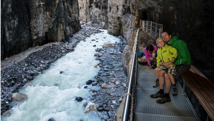
gletscherschlucht-grindelwald-familie-pause