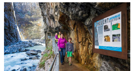
gletscherschlucht-grindelwald-familie-egang - - web@interlaketourism.ch