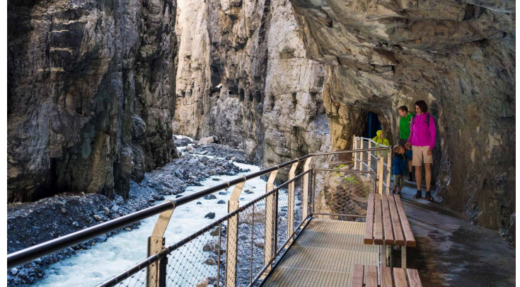
gletscherschlucht-grindelwald-familie-wanderung