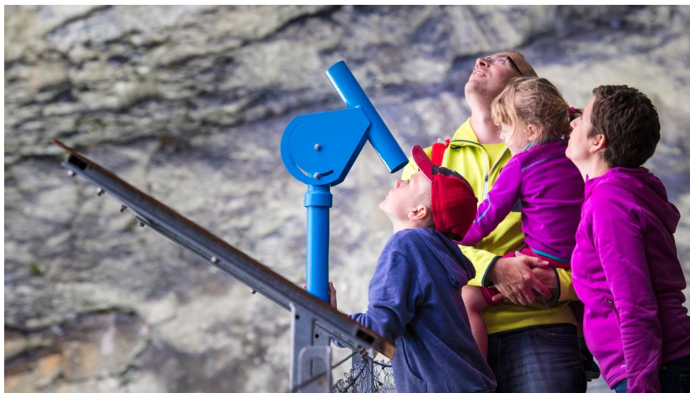
gletscherschlucht-grindelwald-familie-staunen-geologie