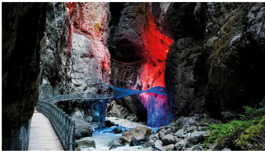
grindelwald-gletscherschlucht-spiderweb-luetschine-felsen-wasser