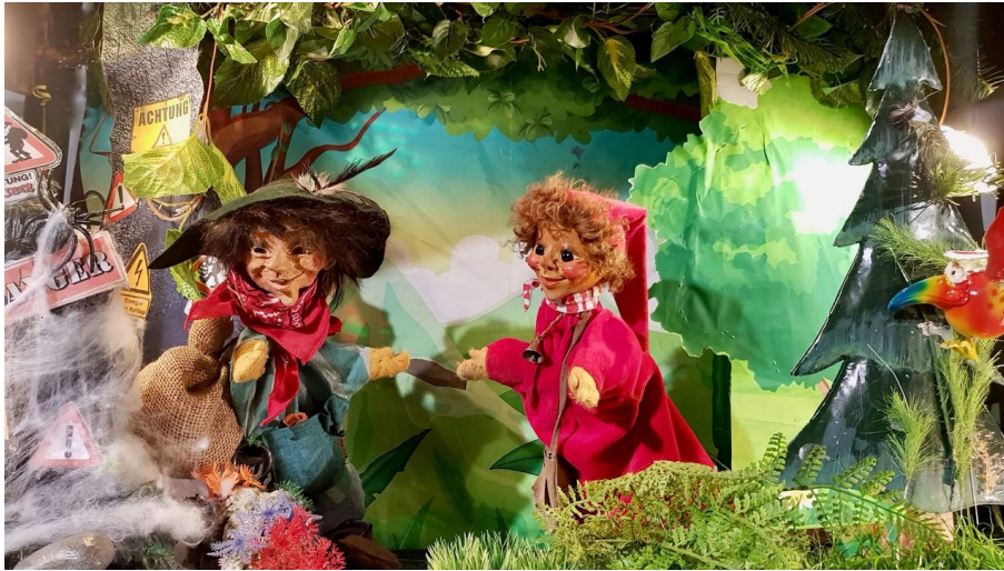
steffisburg-kasperltheater-b-hne-wald