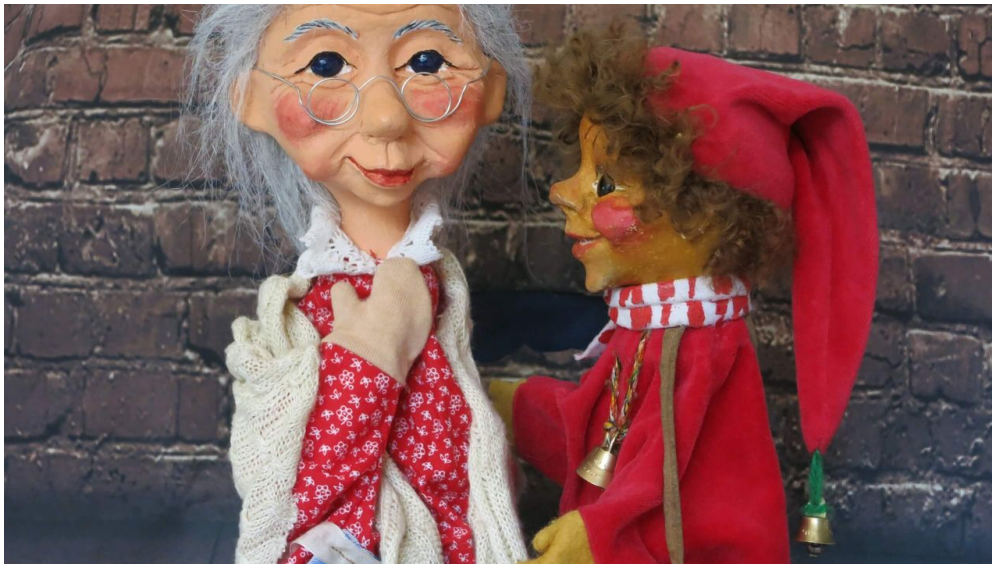
steffisburg-kasperltheater-dame-kasperli