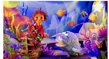
steffisburg-kasperltheater-unterwasser-b-hne-fisch