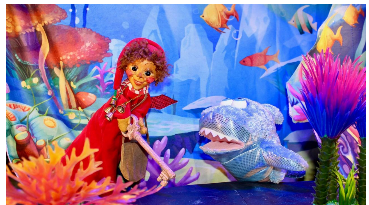
steffisburg-kasperltheater-unterwasserwelt