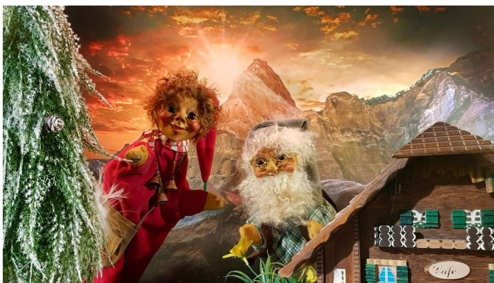
steffisburg-kasperltheater-kulisse-berge-haus