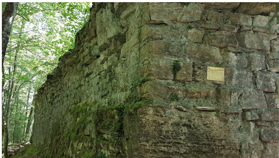
ringgenberg-schadburg-ruine-wald-sommer-wandern