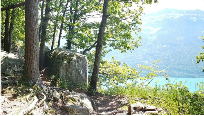
ringgenberg-ruine-schadburg-brienzersee-aussicht-sommer