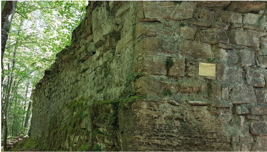
ringgenberg-schadburg-ruine-wald-sommer-wandern