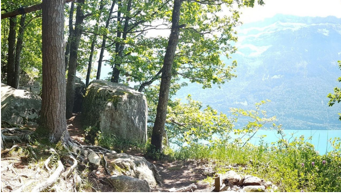
ringgenberg-ruine-schadburg-brienzersee-aussicht-sommer