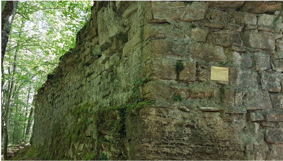
Thun-Thunersee Tourismus, Interlaken Tourismus - web@interlaktourism.ch