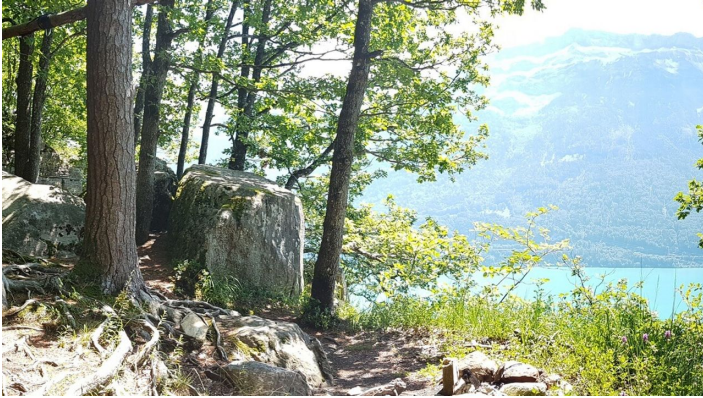
Interlaken Tourismus - web@interlaketourism.ch