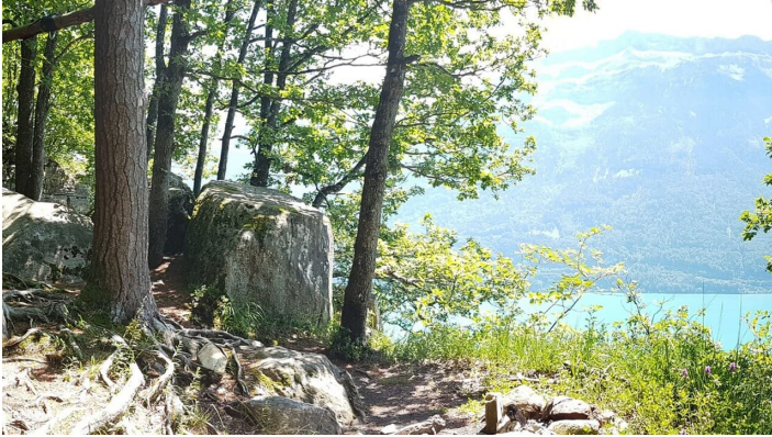
Interlaken Tourismus - web@interlaketourism.ch