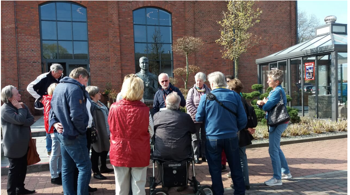
Gästekführung an der Eisenhütte