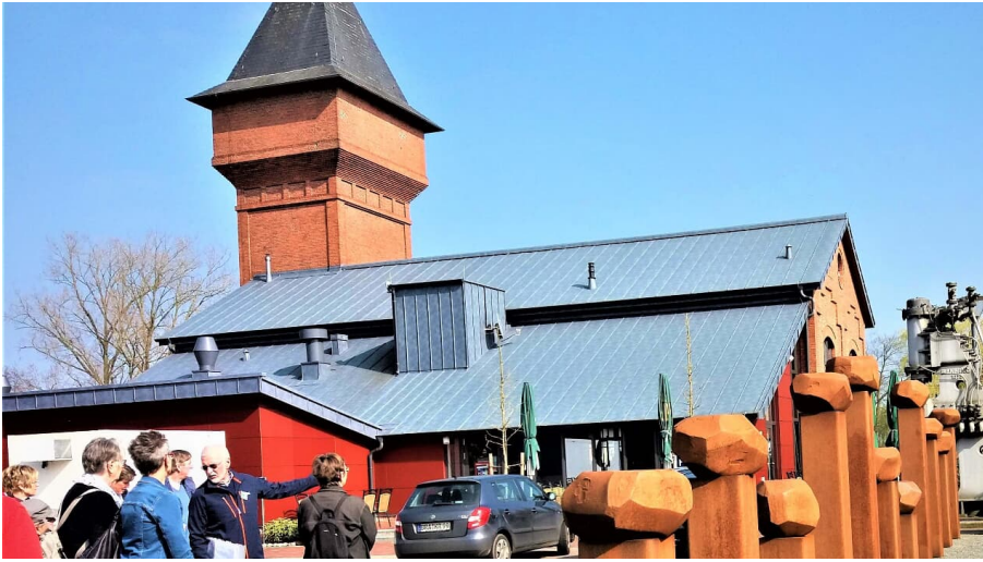
Eisenhütte-Puddelöfen-Augustfehn-Apen - © Sandra Hinrichs