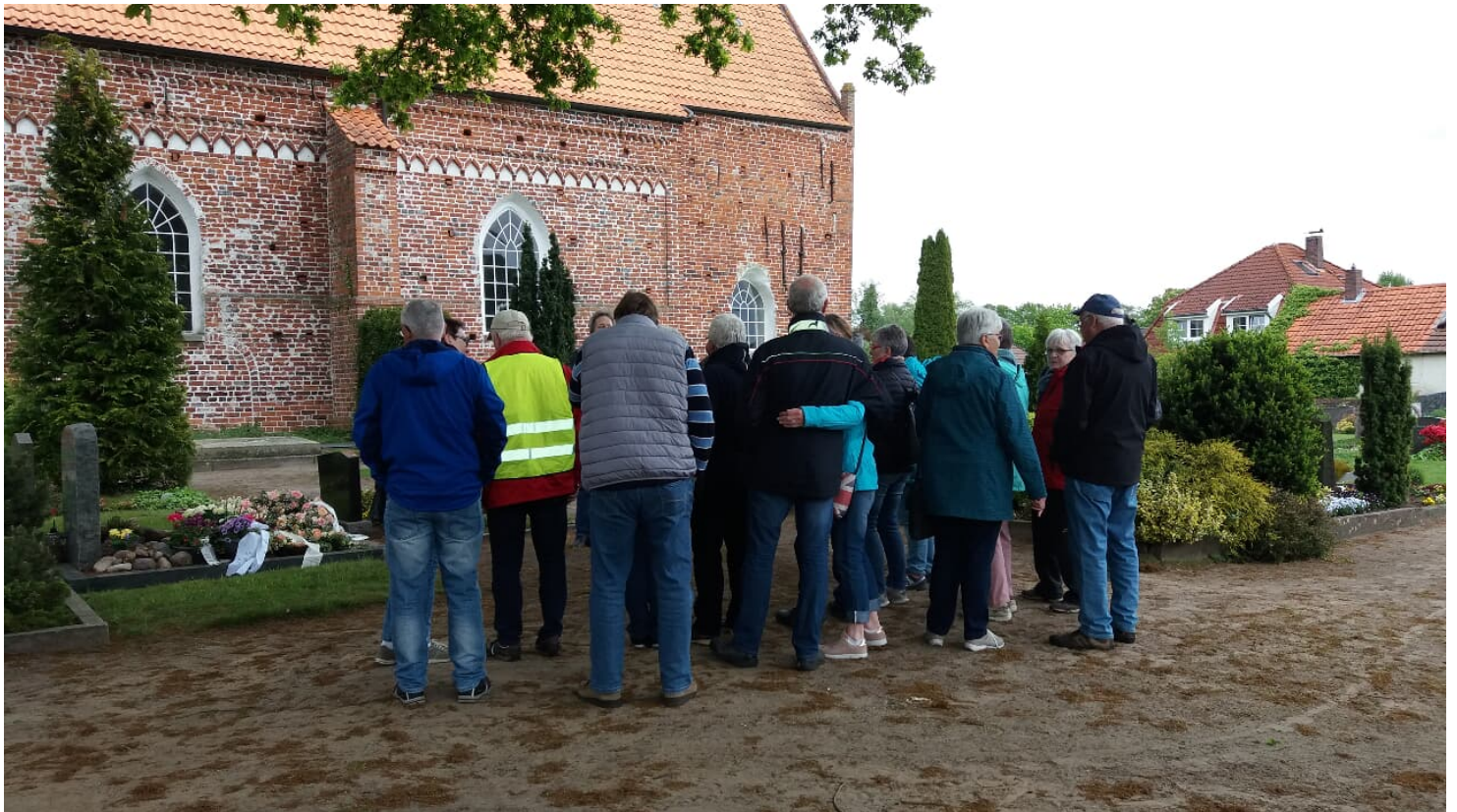
Gästeführung Schall&Rauch

Diese Gästeführung wird auf Anfrage angeboten. Weitere Informationen erhalten Sie bei der Apen Touristik unter Tel. 04489 7373 oder unter info@apen-touristik.de