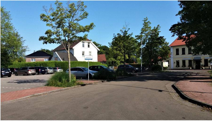
Viehmarktplatz in Apen