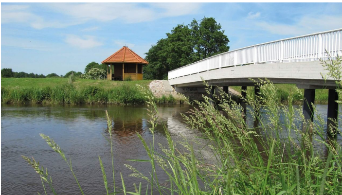
Bokeler Brücke mit Aper Tief