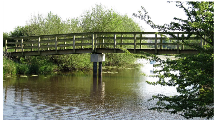
Radler-Brücke in Holtgast