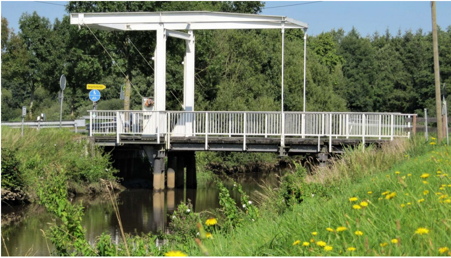
Brücke am Nordloh Kanal