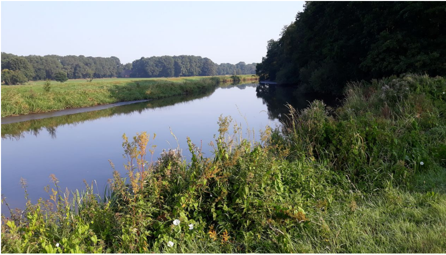
Godensholter Tief - © Antje Geisler