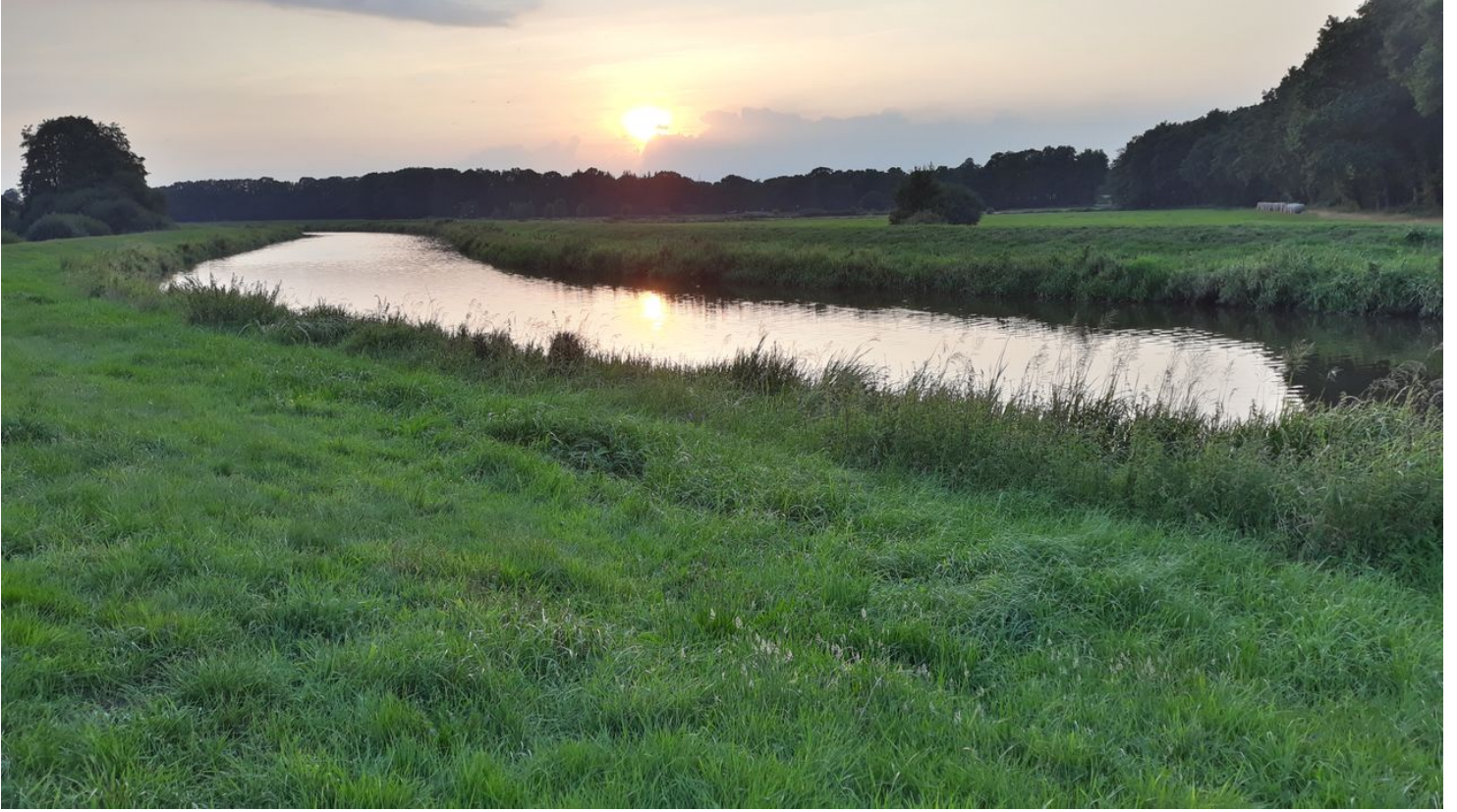
Godensholter Tief