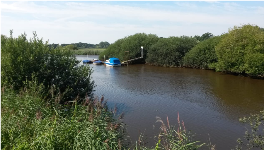
Anleger am Nordloher Tief