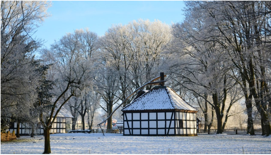
Rossmühle Rahden