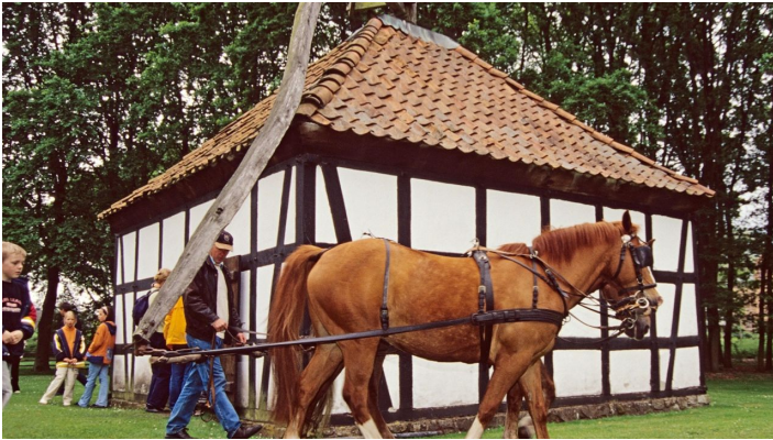
Rossmühle Rahden