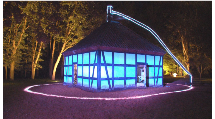
Rossmühle Rahden - LandArt