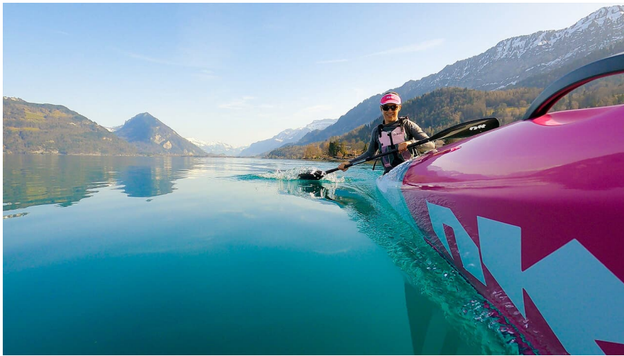
surfskipoint-thunersee-unterwegs-paddeln-blick-richtung-interlaken.jpg