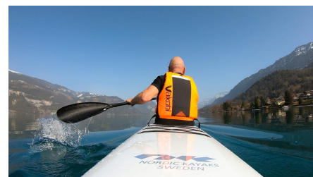
surfskipoint-thunersee-paddel-unterwegs-wasser-sprizer.jpg