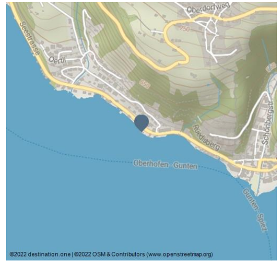
©2022 destination.one | ©2022 OSM & Contributors (www.openstreetmap.org)