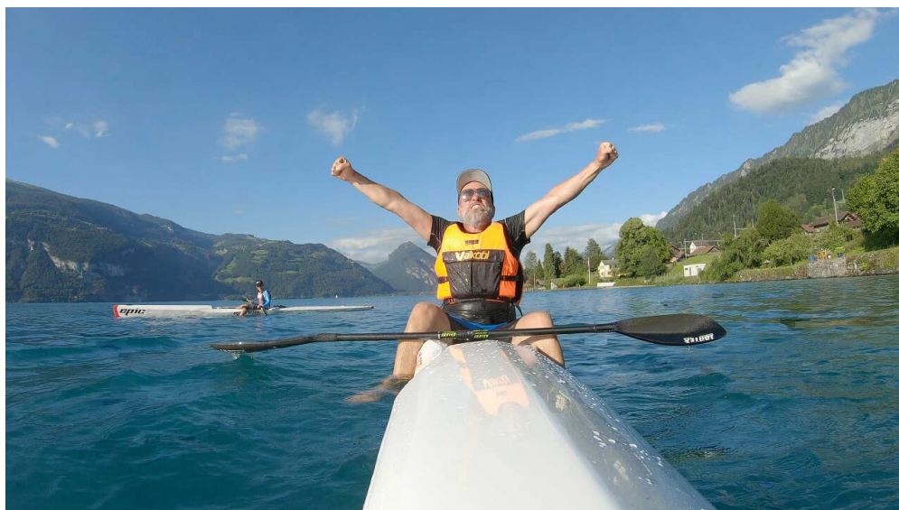
surfskipoint-thunersee-jubeln-auf-dem-wasser.jpg