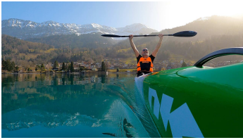
surfskipoint-thunersee-jubeln-vor-traumhafter-kulisse.jpg