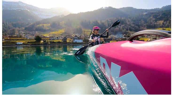
surfskipoint-thunersee-unterwegs-paddeln-neuhaus.jpg