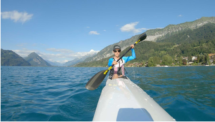
surfskipoint-thunersee-paddelnd-unterwegs.jpg