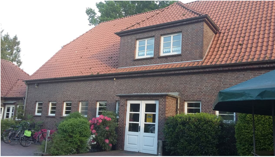
Bokeler Schule (Dörpshus) - © Klaus Dumrath