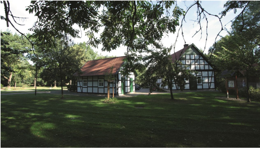
Heuerlingshaus Rothenuffeln