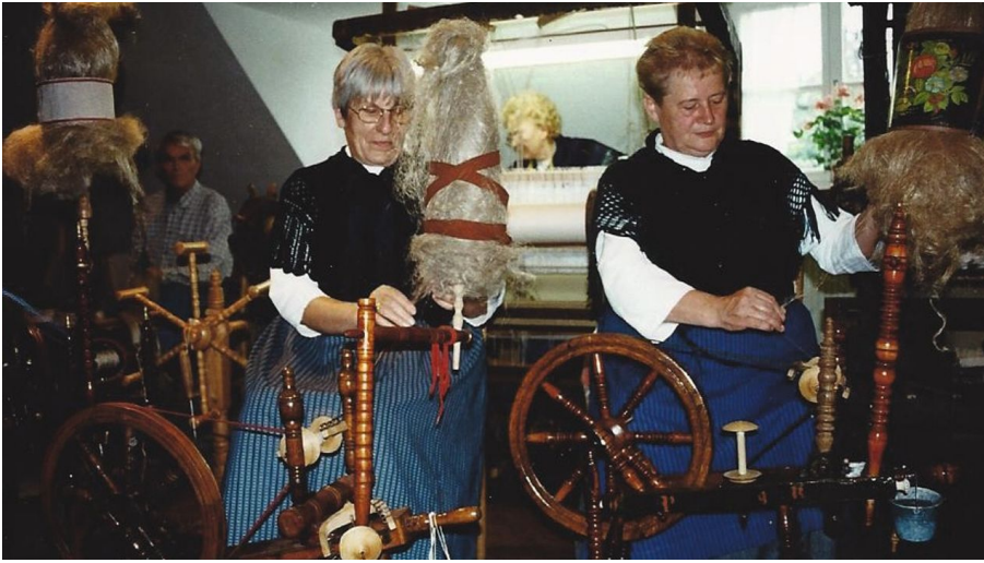
Heimatstube Südhemmern