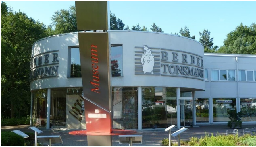
Teppich-Museum Tönsmann