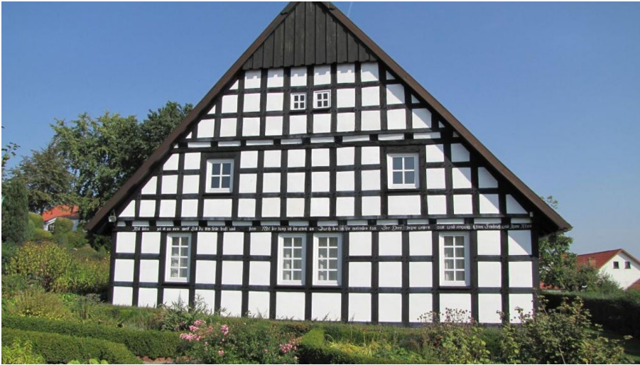
Heimathaus Wehdem