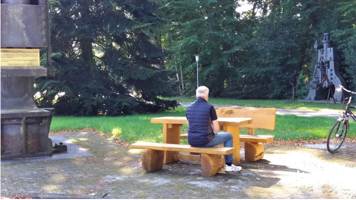
Rastplatz am Stahlwerk Augustfehn II