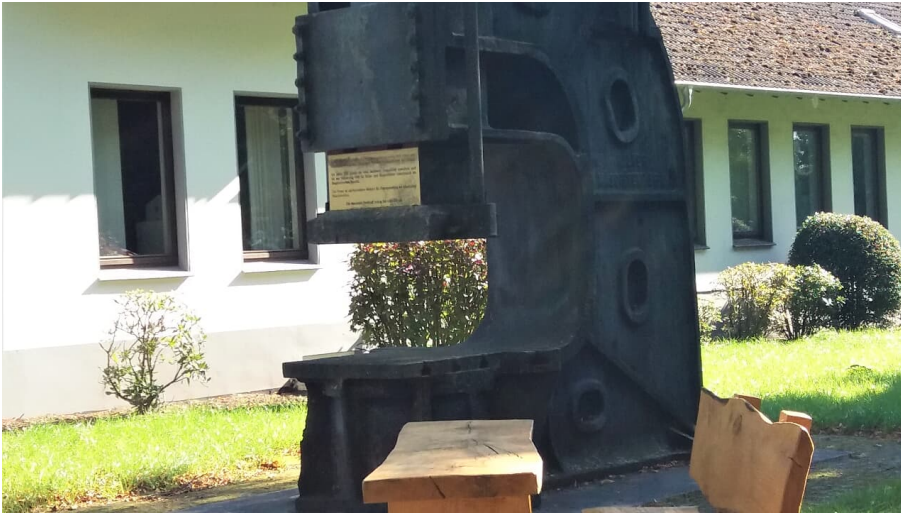
Schmiedehammer am Rastplatz