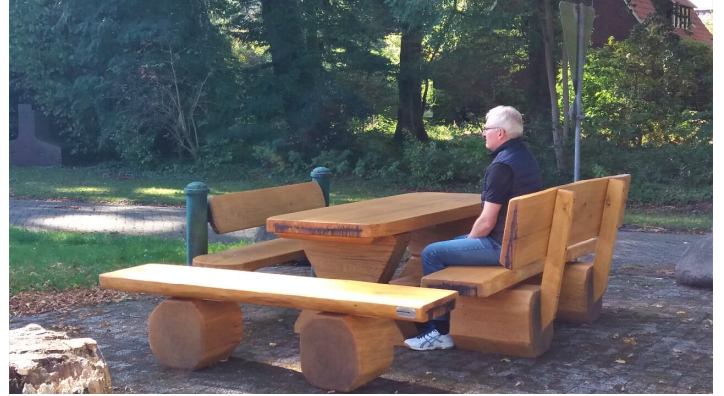
Sitzgruppe am Stahlwerk