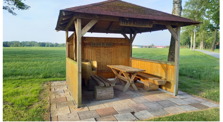
Erholsame Pause in Klauhörn