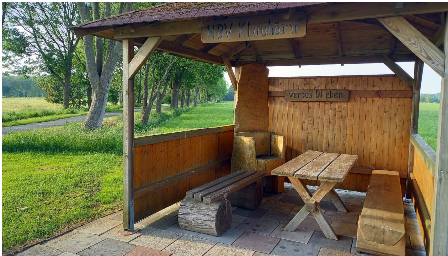
Rastplatz in Klauhörn