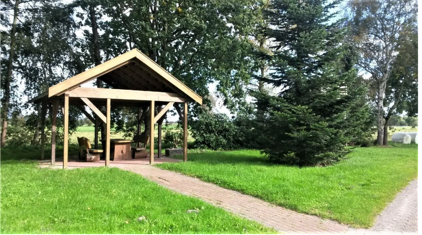
Rastplatz Bokelermoor