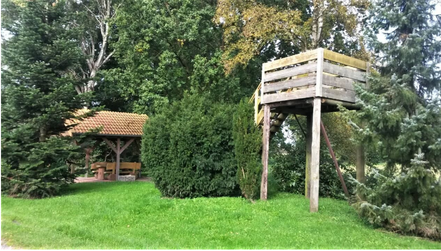
Rastplatz Bokelermoor mit Aussichtsturm