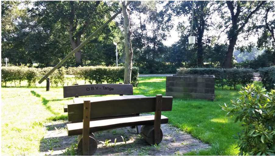
Rastplatz Tange