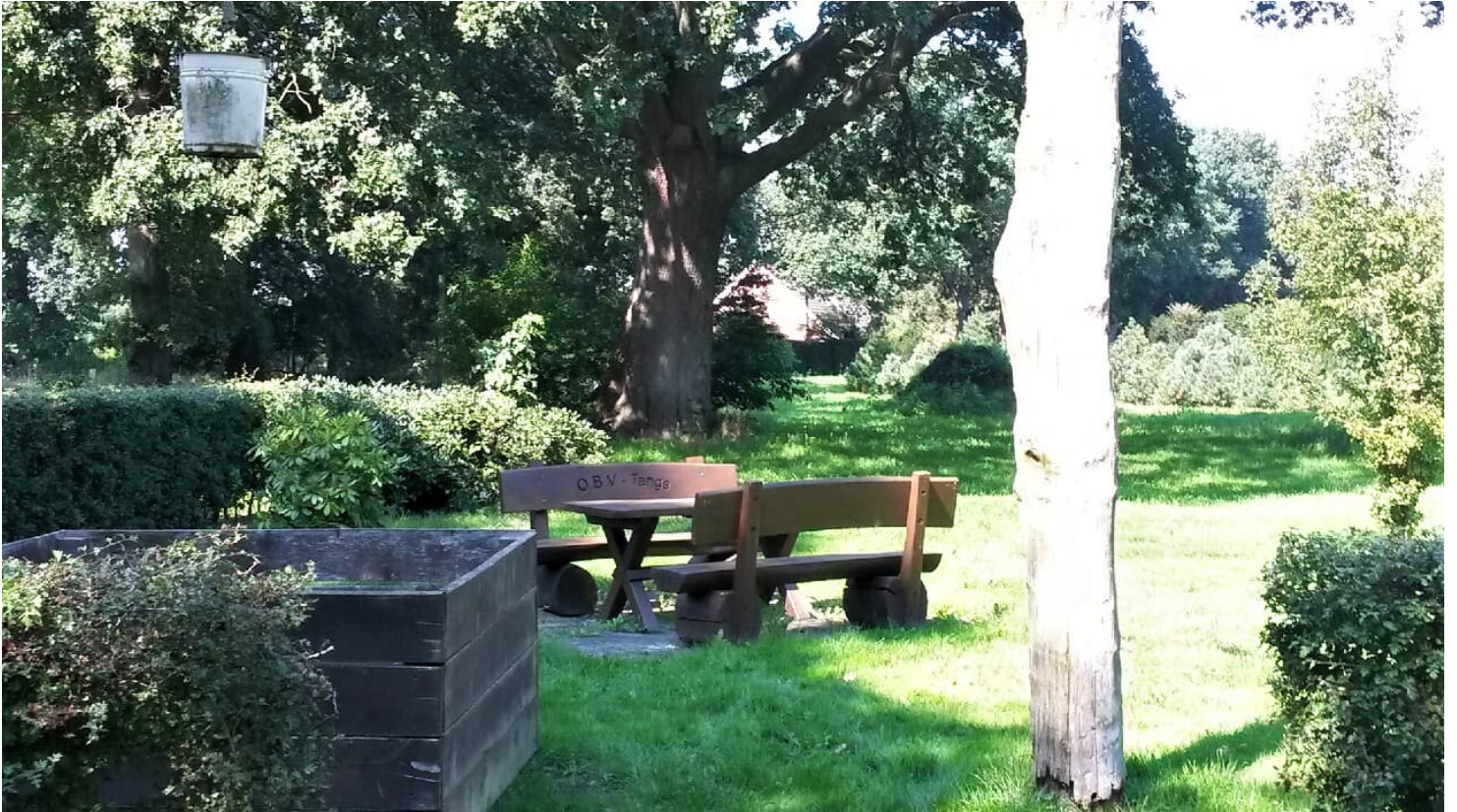
Rastplatz in Tange