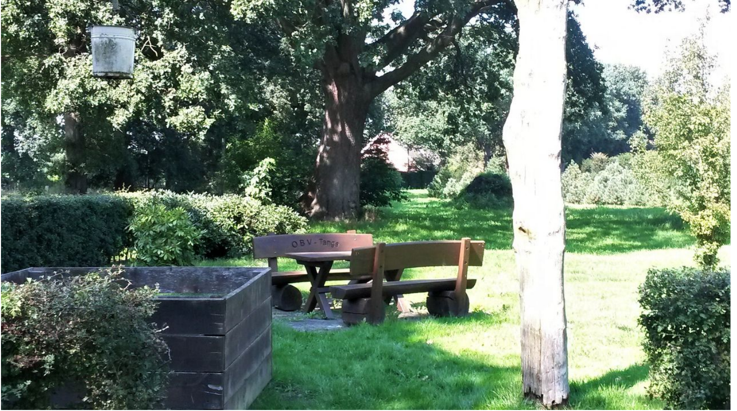
Rastplatz in Tange - © Sandra Hinrichs