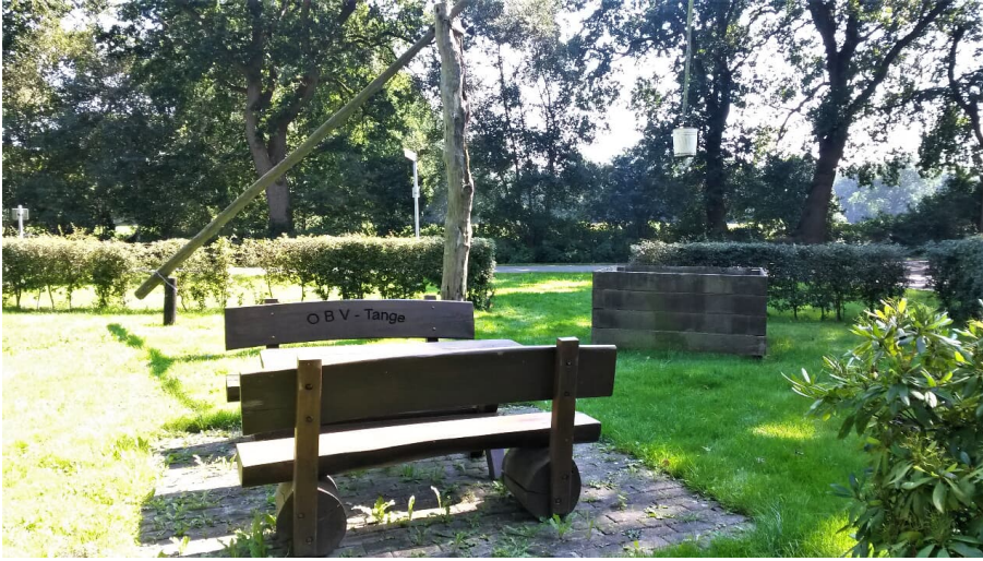
Rastplatz Tange