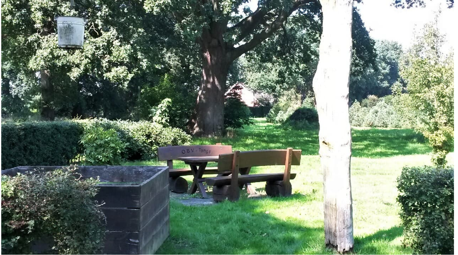
Rastplatz in Tange