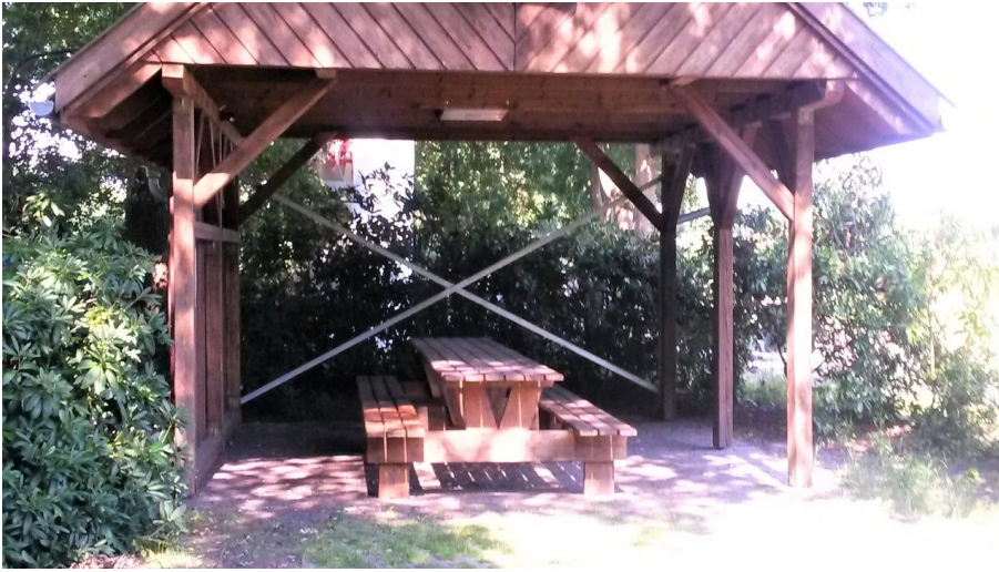
Rastplatz Nordloh - © Sandra Hinrichs