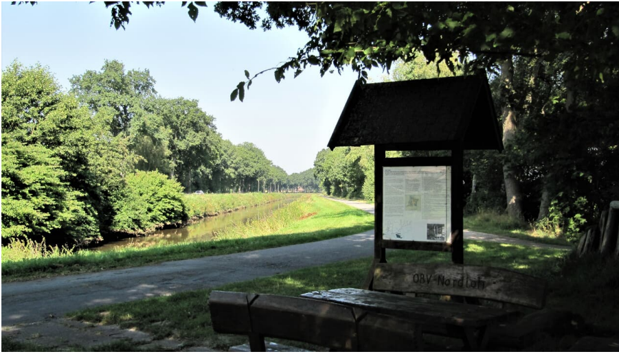
Rastplatz Plaggenhütte