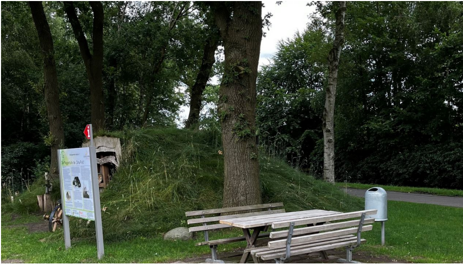
Rastplatz an der Plaggenhütte_Manuela Baumhöfer.jpg