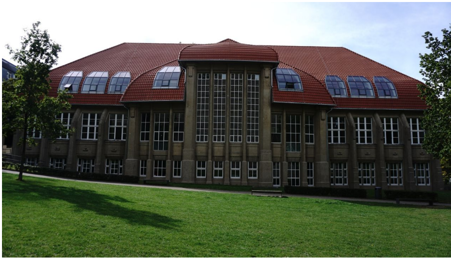
Musik- und Kunstschule Bielefeld - © Teutoburger Wald/Bielefeld Marketing GmbH