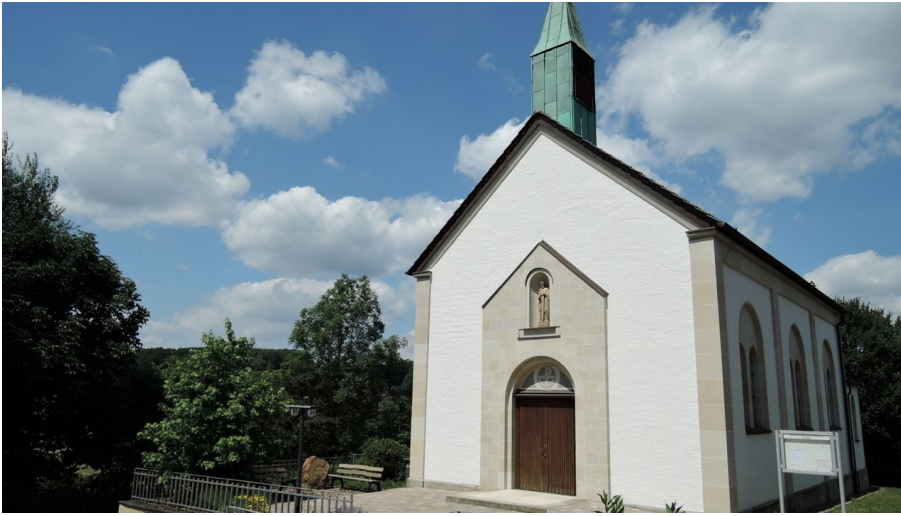
St. Josef Kapelle Feldrom