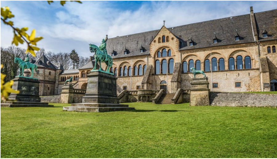
Die Kaiserpfalz im Frühling